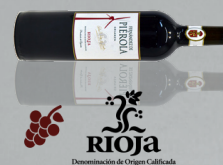
Fernández de Piérola D.O. Rioja (18 meses de barrica, 18 months in barrel) Tempranillo