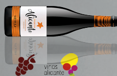
Puerto de Alicante (7 meses de barrica, 7 months in barrel) Syrah