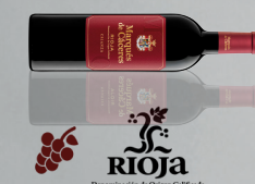
Marqués de Cáceres Crianza