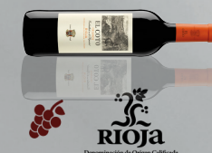
El Coto Crianza Tempranillo