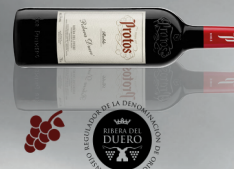
Protos D.O. Ribera del Duero Roble Tinta del país